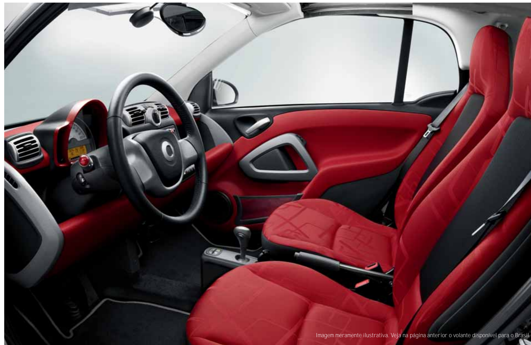
Imagem meramente ilustrativa. Veja na página anterior o volante disponível para o Brasil.